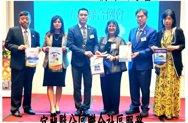
宜蘭縣分區聯合社區服務 「新南國小兒童課後照顧服務計畫」捐贈典禮