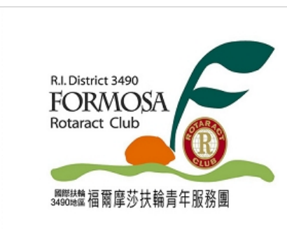
【11 RAC Formosa】