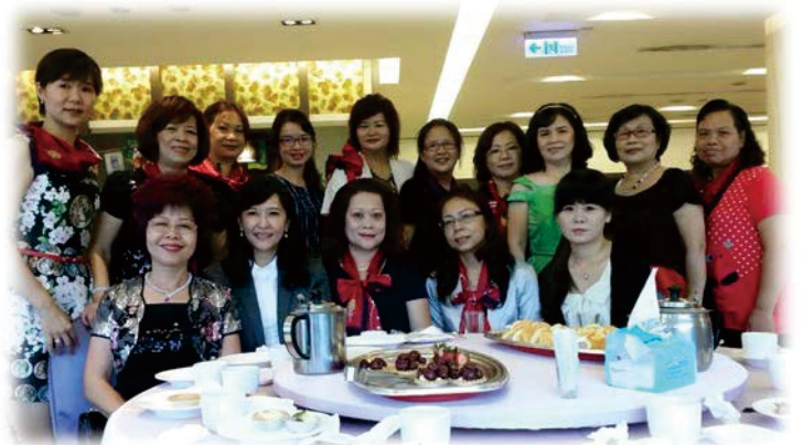
總監夫人與新東社夫人們美麗倩影