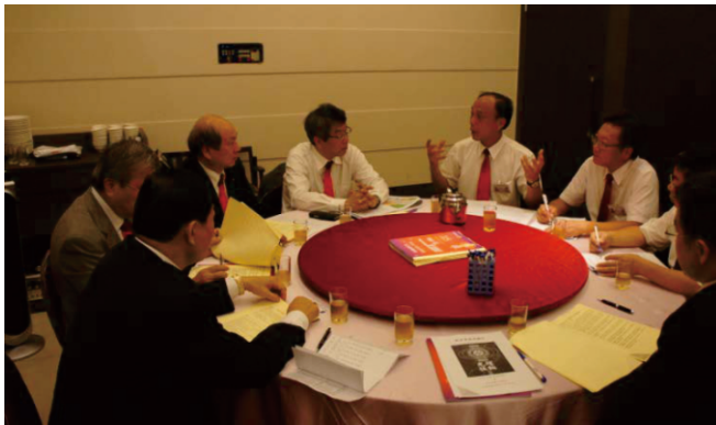
與總監團隊報告社務行政會議