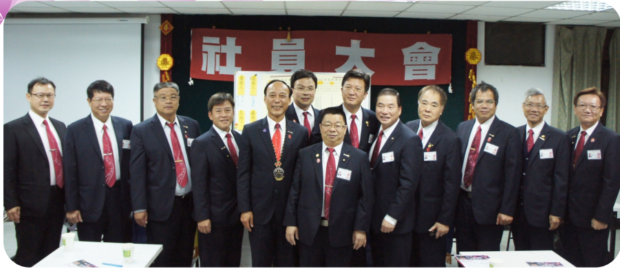
歡喜順利選出 2015-2016 度理事們