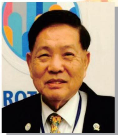
新莊東區社 2017-18 社長