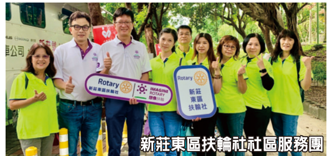
新莊東區扶輪社社區服務團