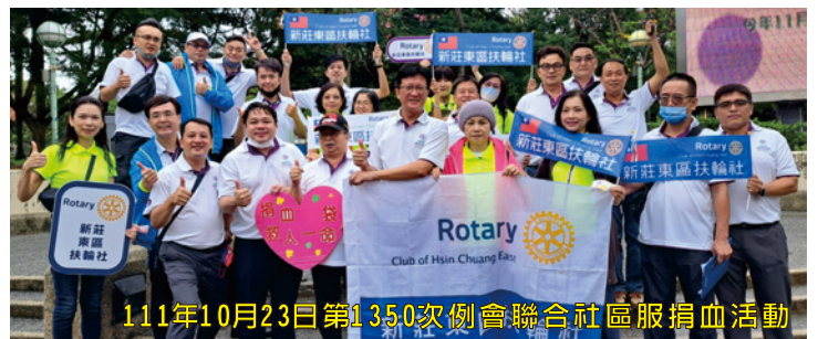
111年10月23日第135.0次例會聯合社區服捐血活動