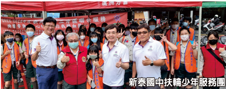
新泰國中扶輪少年服務團