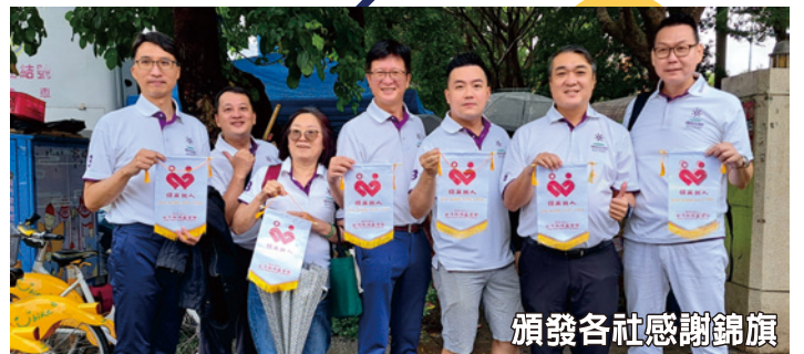
頒發各社感謝錦旗