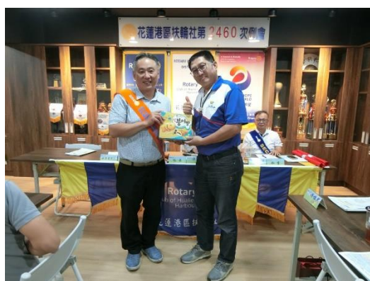
Bulega 拍得社當出國帶回之紀念品