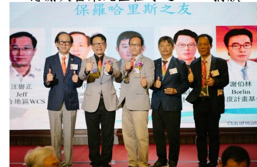
頒發本年度保羅哈里斯之友獎