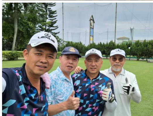
與基隆東區社球敘