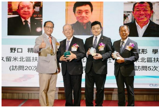
表揚來訪 5 次以上