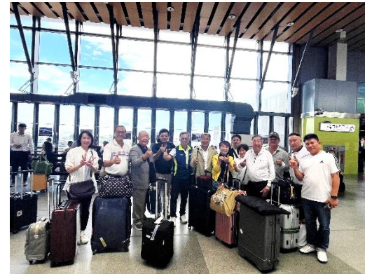
車站歡送久留米北區社