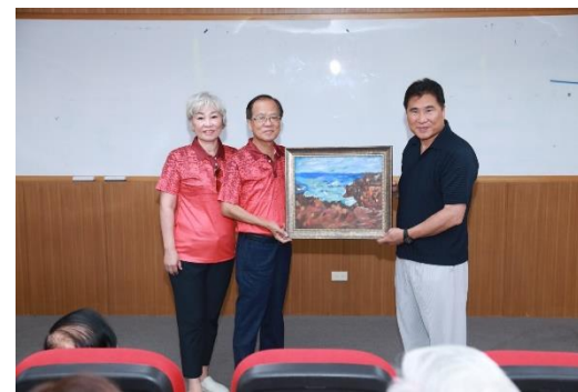
PDG Young 安排台中港區社前往石資中心參觀並於賴桑設午宴