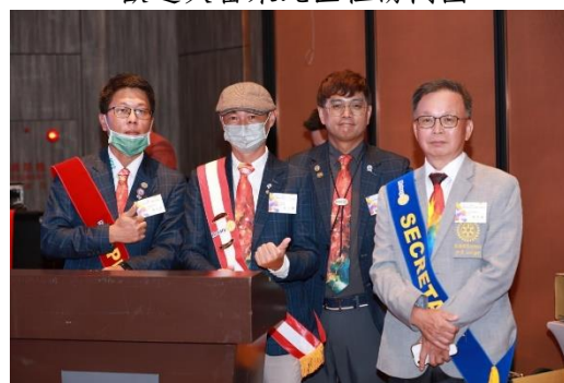
會場靈魂人物合影