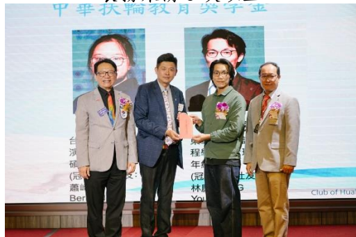
頒發中華扶輪獎學金