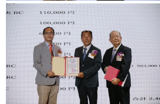
感謝久留米北區社等之 0403 捐款