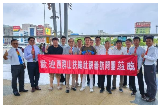
歡迎西群山社訪問團