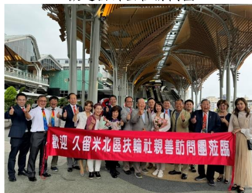
歡迎久留米北區社訪問團