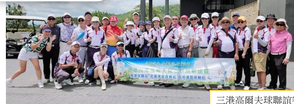
三港高爾夫球聯誼賽