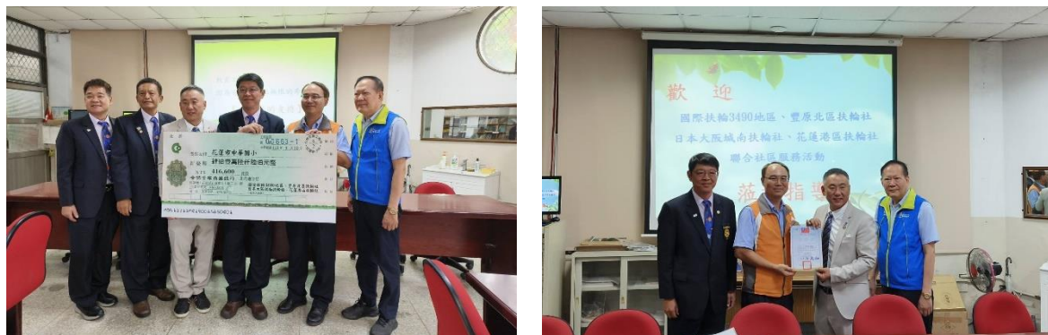
中華國小教學環境改善計畫捐贈儀式