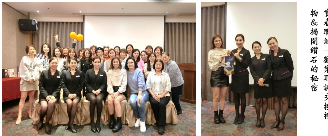
寶春聯誼—歡樂耶誕交換禮物 & 揭開鑽石的秘密