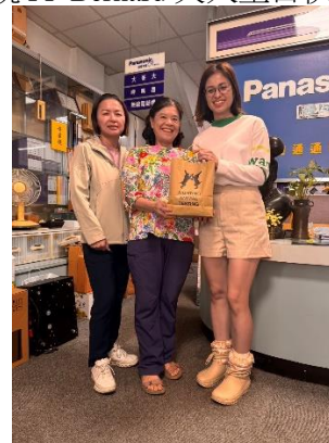
祝 PP Telephone 夫人生日快樂