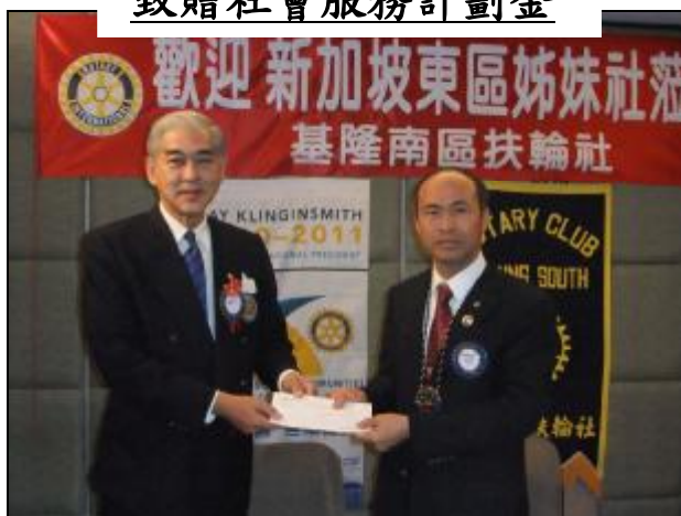
100 年健康操口令

前點頭後點頭 你就不會暈大頭 左壓壓右壓壓 你就不會高血壓 左肩動右肩動 你就不會神經痛 左擺手右擺手 你就不會富貴手 左扭腰右扭腰 你就不會水桶腰 左抬腿右抬腿 你就不會蘿蔔腿 前踢腳後踢腳 你就不會香港腳 前跳跳後跳跳 你就不會死翹翹 左出拳右出拳 包你今年一定賺大錢