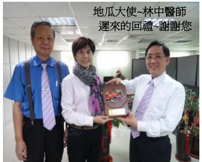
地瓜大使~林中醫師 遲來的回禮~謝謝您