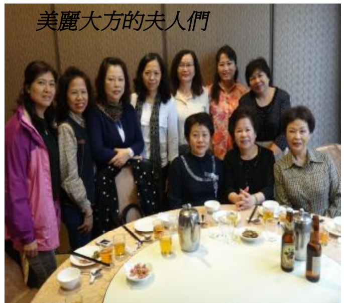
美麗大方的夫人們