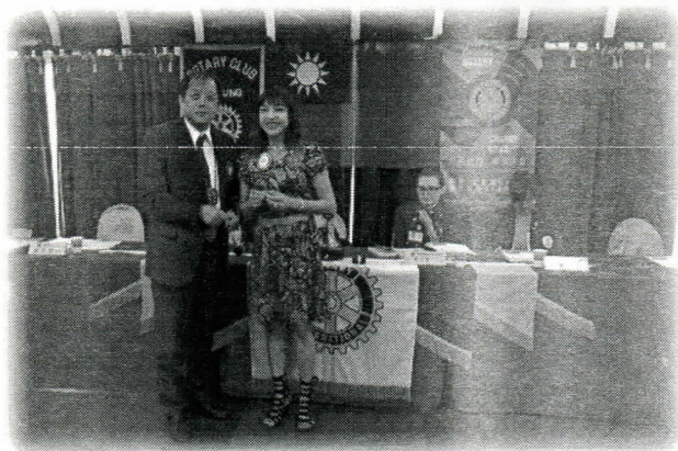
社長幫Apple戴扶輪徽章