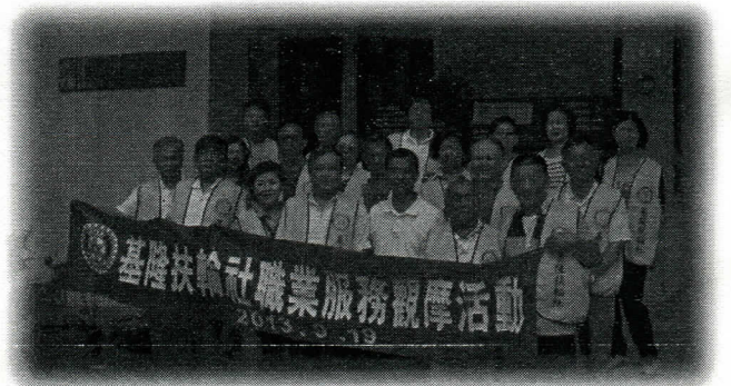
呂美麗精雕館職業觀摩

★插播一下，社友們中午吃完飯後，要啟程到亞典菓子工場去職業觀摩，沒想到又發生一件事，社長竟然往回開，也就是往北上的路走，總之，輾轉之下，社長終於來到目的地了，完成了職業觀摩。