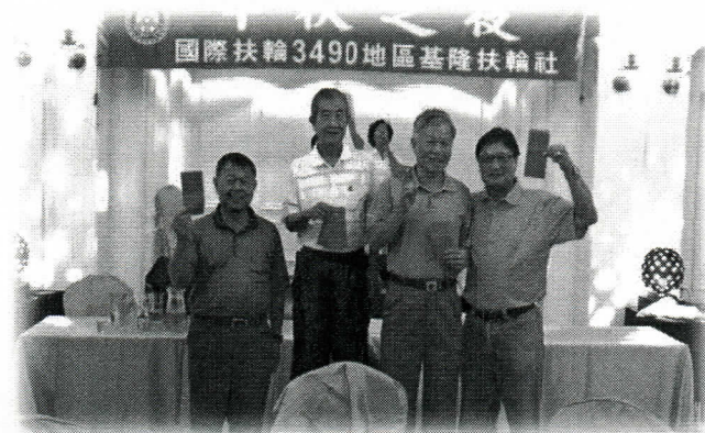
擲骰子比賽的優勝者