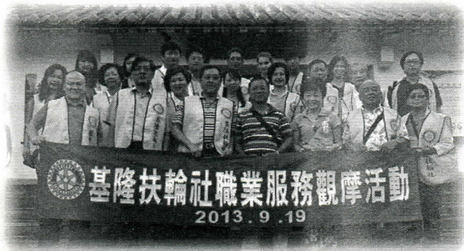
第一站到坪林茶博館職業觀摩