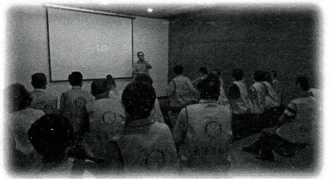
社友們很認真聽講亞典的由來