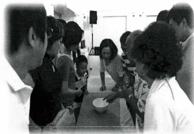
擲骰子比賽，大家很認真