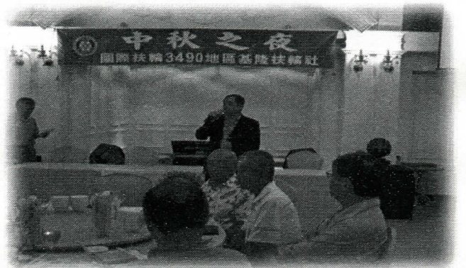
中秋晚會開始，社長致詞

辦事處：基隆市孝二路39號五樓503室 電話：(02) 24256304 傳真：(02) 24287916 通訊處：基隆郵政信箱第64號 E-Mail：keelung.rotary@msa.hinet.net