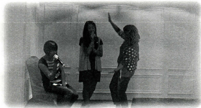
Alanwin的千金上台高歌一曲，唱得很不錯喔!

辦事處：基隆市孝二路39號五樓503室 電話：(02) 24256304 傳真：(02) 24287916 通訊處：基隆郵政信箱第64號 E.Mail：keelung.rotary@msa.hinet.net