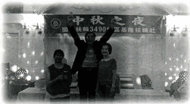
猜拳比賽的優勝者