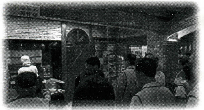
參觀製作過程，看起來好好吃喔!

★插播一下，社友們中午吃完飯後，要啟程到亞典菓子工場去職業觀摩，沒想到又發生一件事，社長竟然往回開，也就是往北上的路走，總之，輾轉之下，社長終於來到目的地了，完成了職業觀摩。