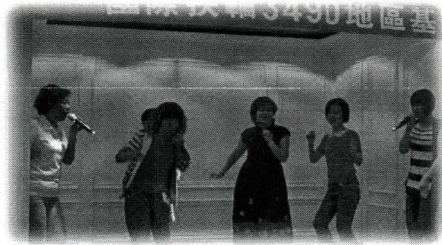
夫人們勁歌熱舞，High到最高點