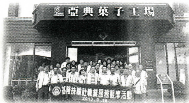
去亞典菓子工場職業觀摩