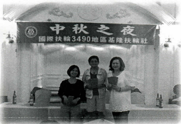
喝啤酒比賽的優勝者(女子組)