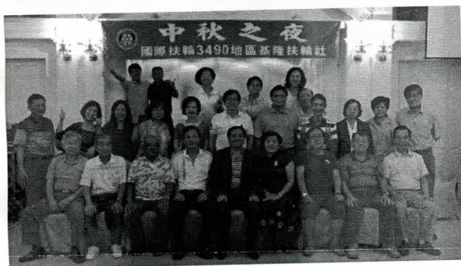
中秋晚會結束大合照