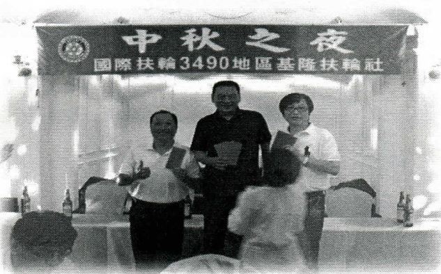
喝啤酒比賽的優勝者(男子組)