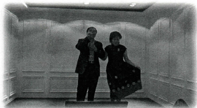
社長唱歌，夫人陪伴在一旁，真是甜蜜蜜。