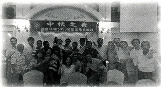
真是一大創舉，三公升的酒被喝完了