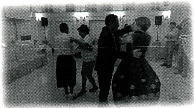
社長和夫人也下場跳舞，兩人感情好甜蜜，真令人羨慕。