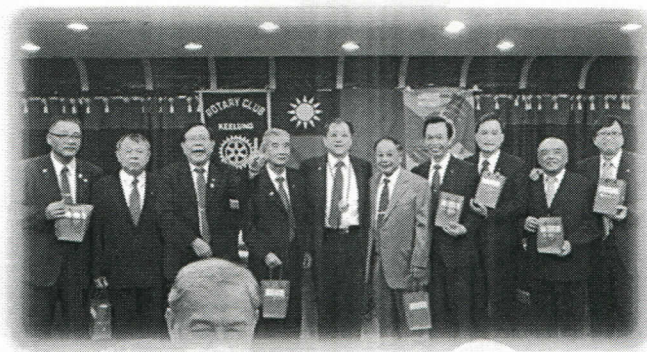
10月份出席率百分百第一組