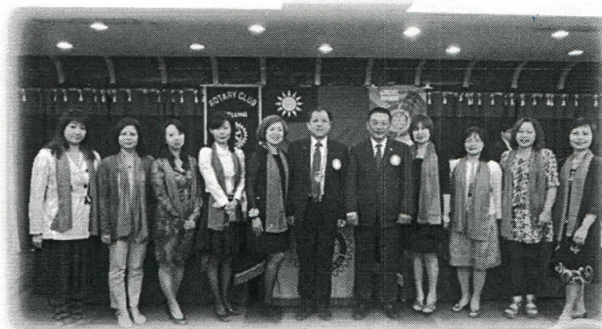
美麗的夫人第二組