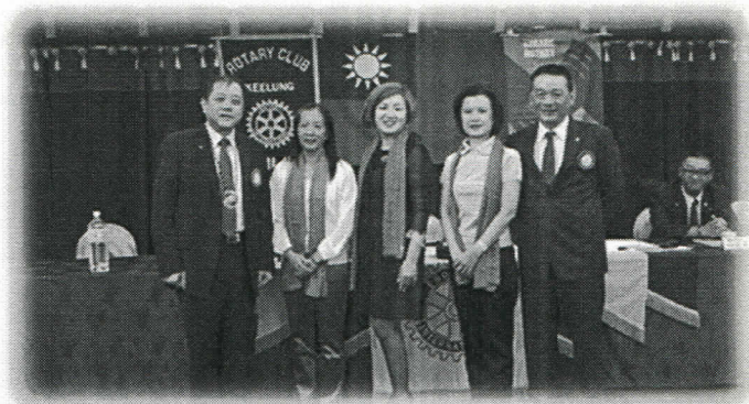
美麗的夫人第三組