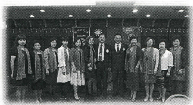
美麗的夫人第一組