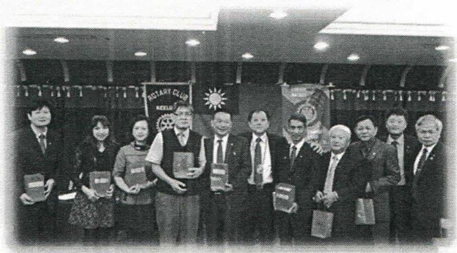
10月份出席率百分百第二組