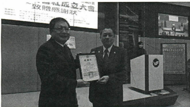
檢察長致贈感謝狀