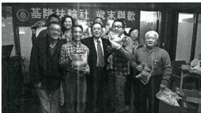
11 月份出席百分百第二組