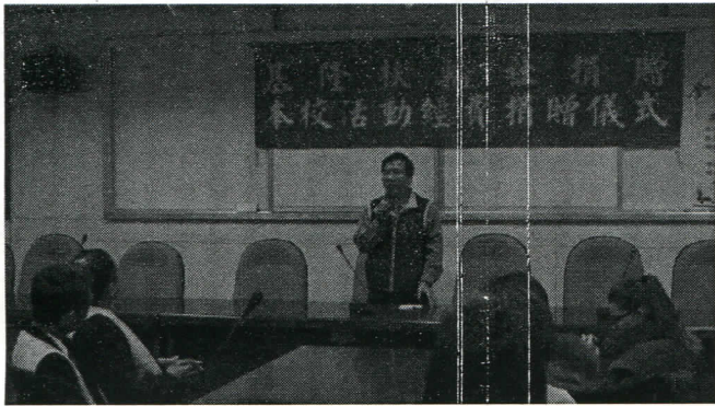
暖暖高中校長致詞