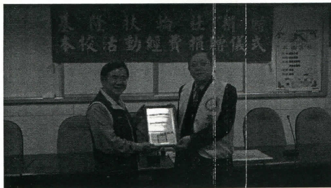
暖暖高中校長致贈感謝狀