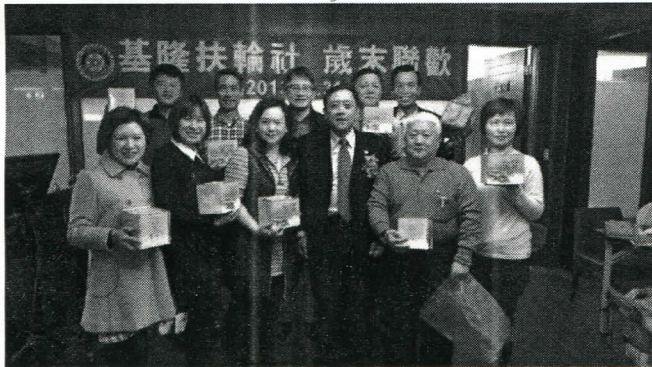
10 月份出席百分百第二組