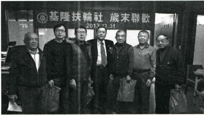
10 月份出席百分百第一組