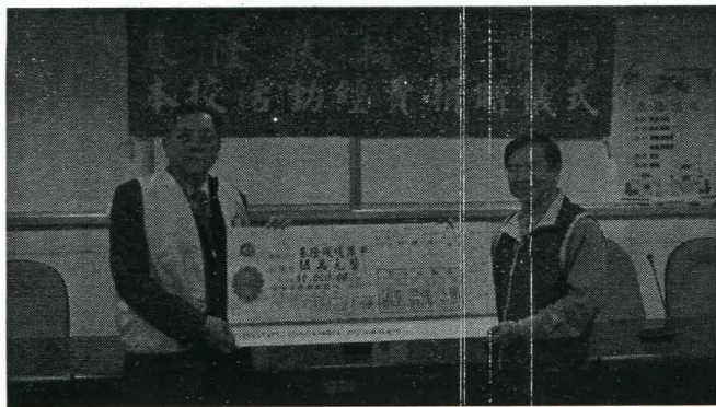
社長捐贈活動經費