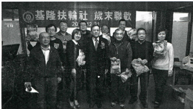
11 月出席百分百第一組