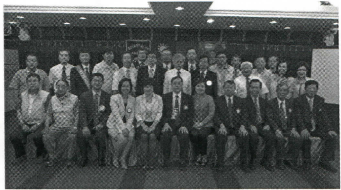
社友與演講人大合照