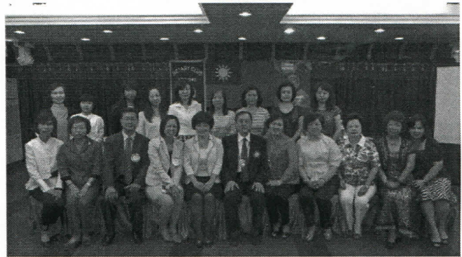
寶眷與演講人大合照