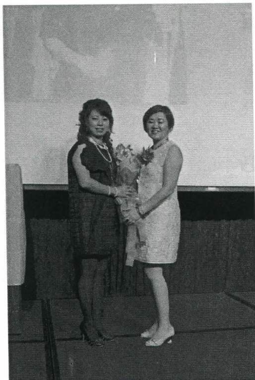
新任社長夫人獻花給卸任社長夫人