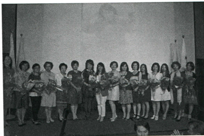
基隆社夫人們大合照