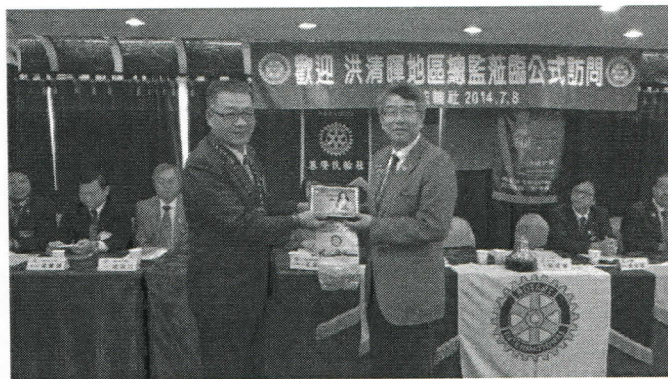
社長致贈紀念品及小社旗