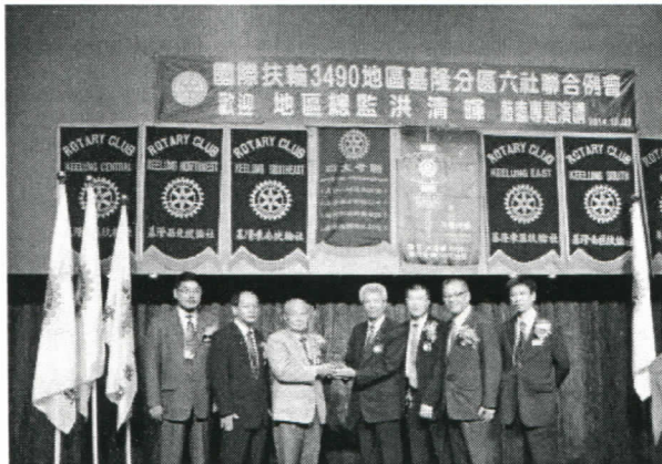
頒發 CPR 感謝獎盃給東南社 PP Tea