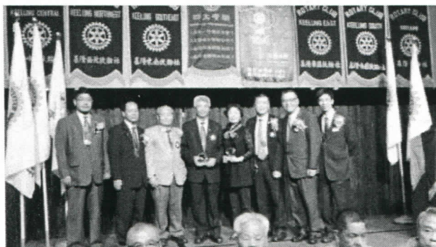
六社社長與受獎人大合照