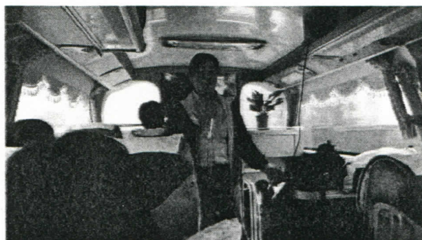
感謝豐原社社長陪同道及導覽