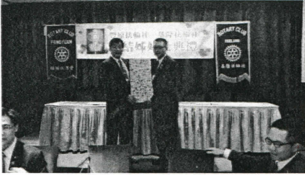
豐原社社長贈送給本社社長禮品