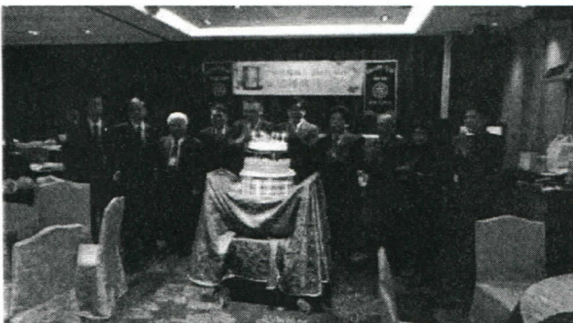
豐原社準備蛋糕與本月生日婚慶 的社友共歡