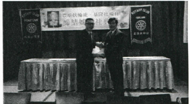
豐原社社長代表贈送 本社每位社友一盒餅