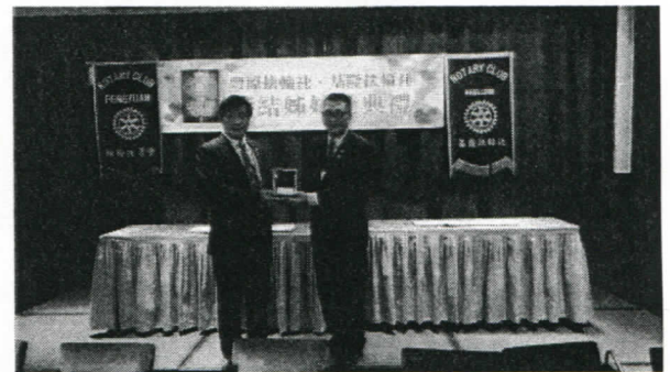
本社贈送豐原社每位社友一座紀念座

辦事處：基隆市孝二路39號五樓503室 電話：(02) 24256304 傳真：(02) 24287916 通訊處：基隆郵政信箱第64號 E. Mail: keelung.rotary@msa.hinet.net