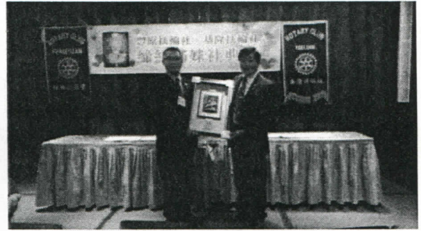
豐原社贈送社對社禮品