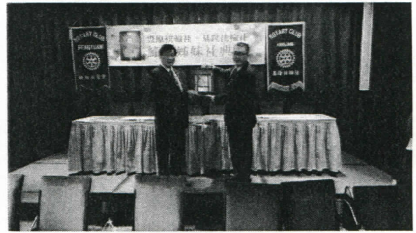
本社贈送社對社禮品