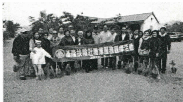
參觀豐原社秘書的五葉松園區