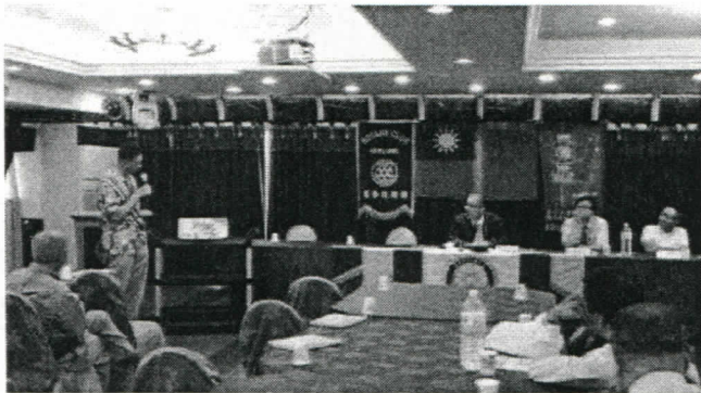
日本那珂湊友好社紀念品競標中