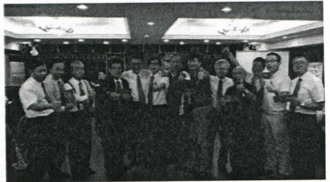
五月份出席百分百