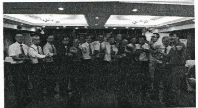
六月份出席百分百