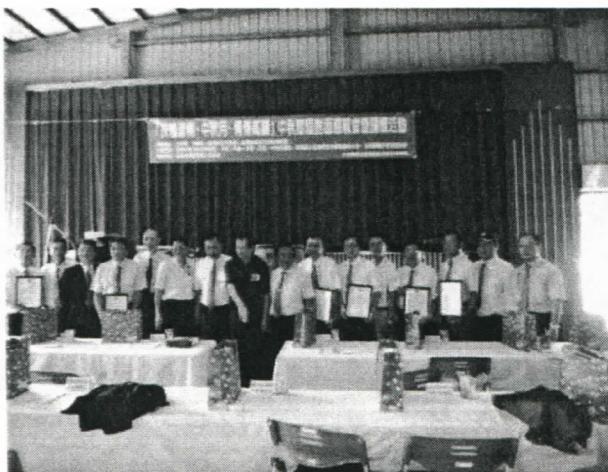
9/22 六社共同贊助基隆監獄 中秋節面對面懇親會活動經費