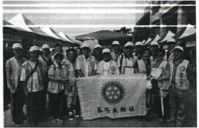
9/19 失智症宣導健走活動-大合照