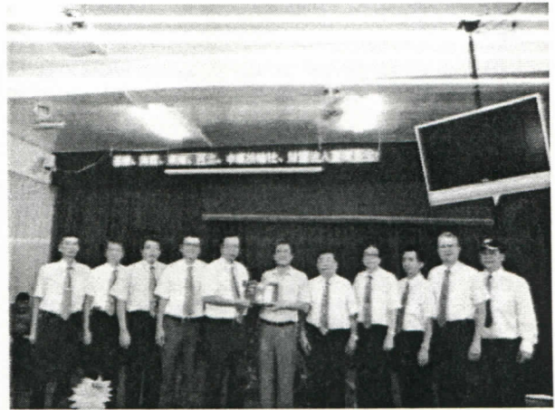
9/22 六社共同贊助基隆看守所 中秋節面對面懇親會活動經費