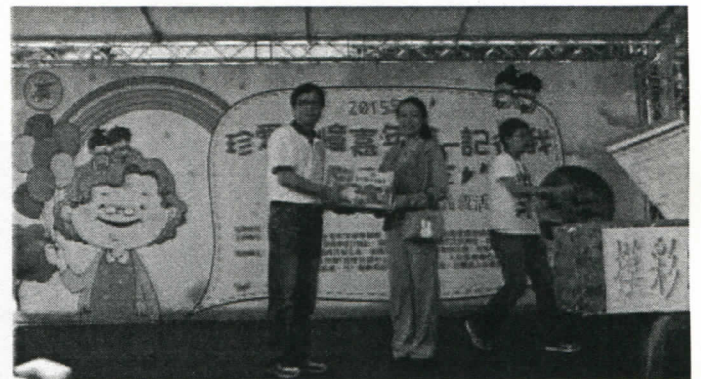
社長幫忙致贈摸彩品給民眾