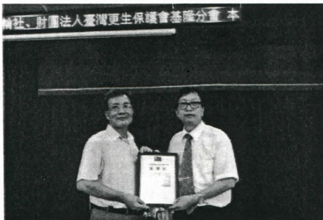
9/22 矯正署基隆看守所 致贈感謝狀給社長