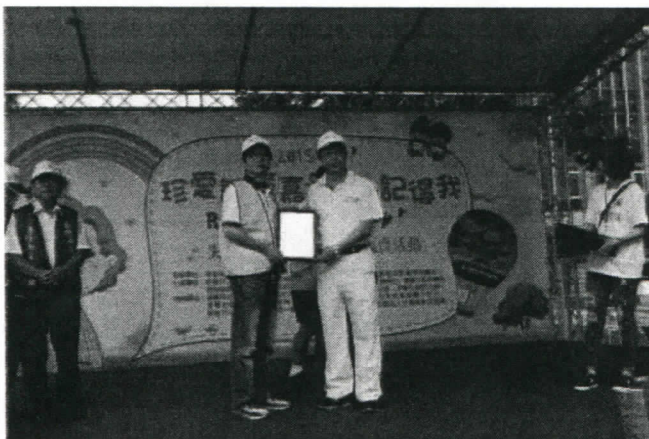
基隆醫院院長致贈感謝狀給社長