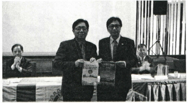
兩社社長交換社旗