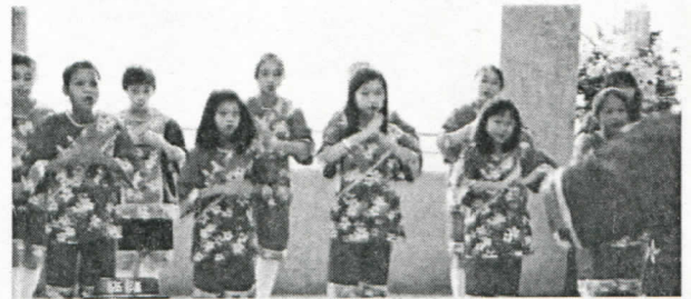
學童演唱客家歌曲歡迎