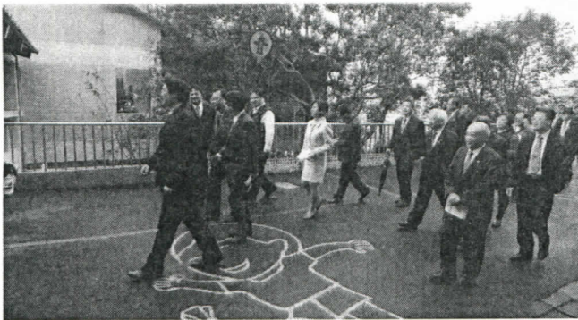
林右昌市長、各級長官及本社社友熱烈出席此次捐贈圖書儀式