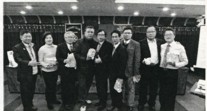
12 月份百分百出席-第二組