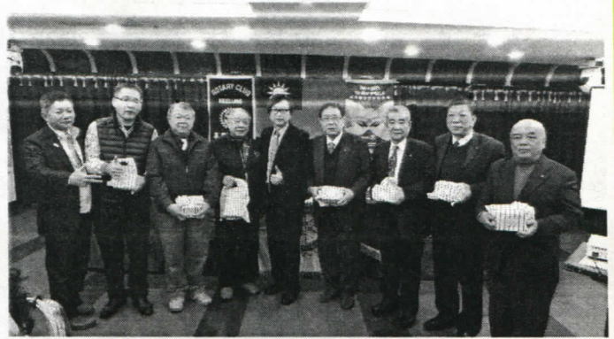
12 月份百分百出席-第一組