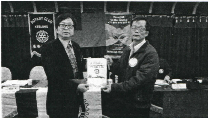
社長致贈小社旗及車馬費

★ 社友 Easy 跟社長、社長當選人及社友致歉，因工作職務上的調動，不得不退社，如果以後有機會會再回基隆扶輪社。