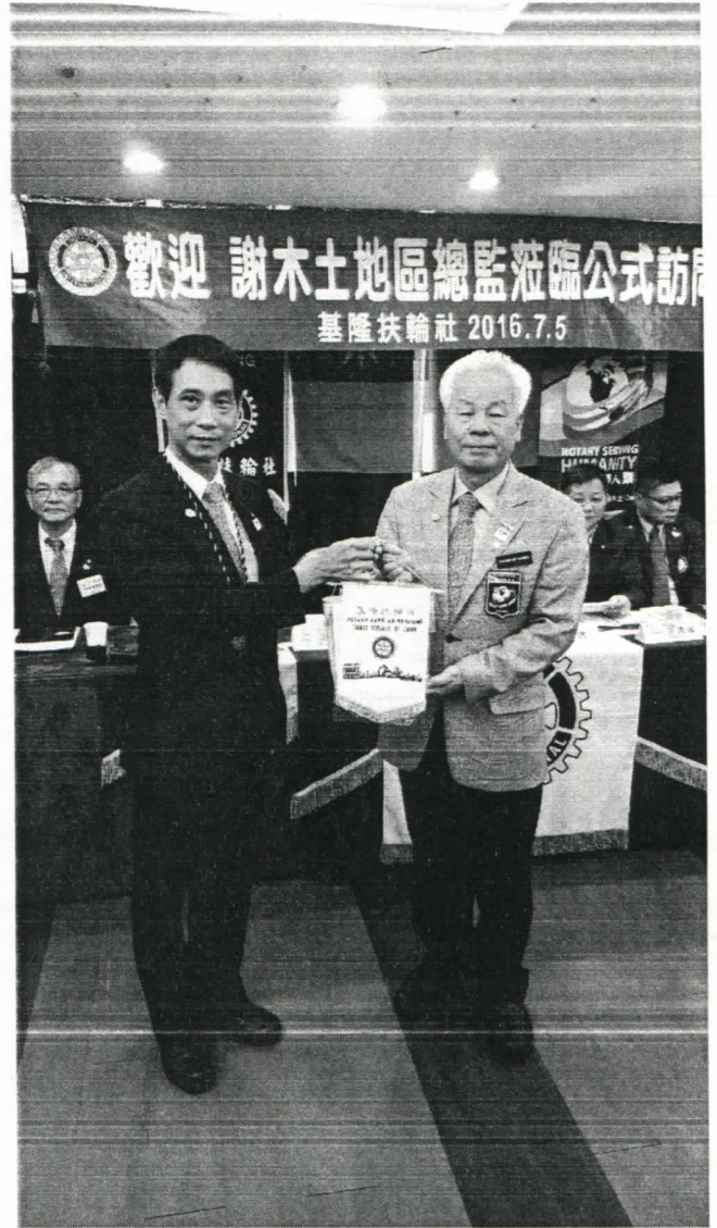
社長贈送紀念品給總監團隊