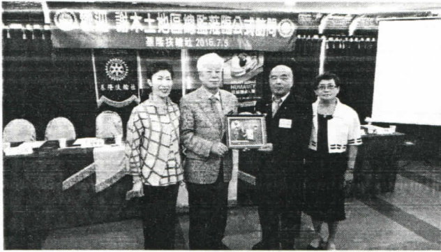
總監贈送紀念品給助理總監賢伉儷