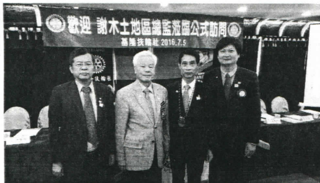
總監頒發保羅哈里斯徽章