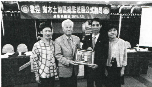
總監贈送紀念品給社長賢伉儷