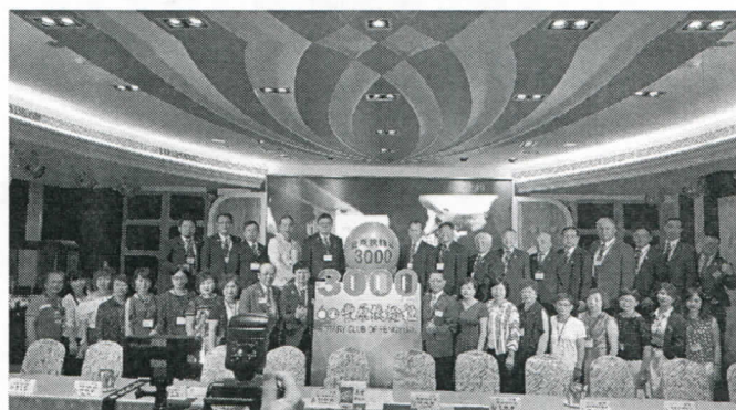
與豐原社第 3000 次例會聯合例會