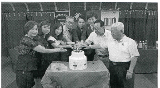
7 月份及 8 月份生日婚慶