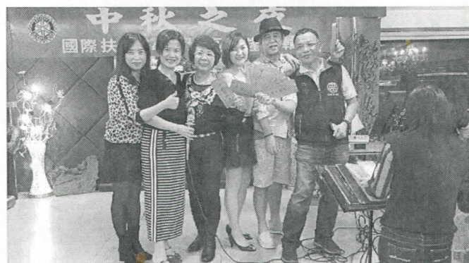
夫人歡唱開心領紅包