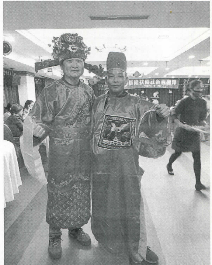
Alanwin 社長發送紅包、Halley 秘書發送糖果