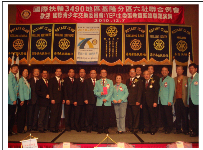
基隆分區本年度第二次聯合例會