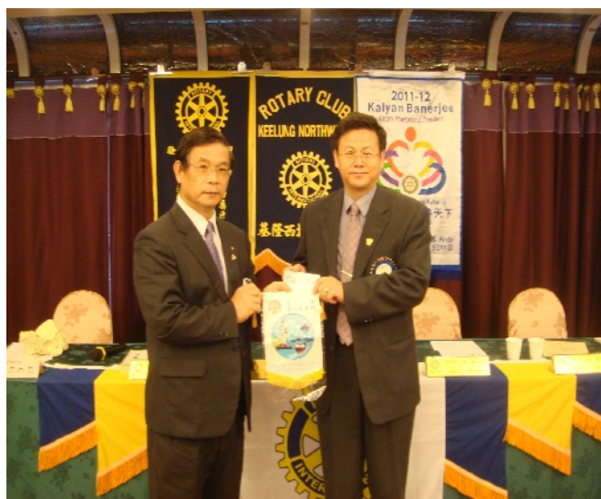
社長 Soybean 致贈洪百其講師小社旗