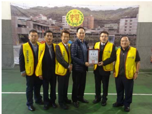
社區服務-中華國小圖書捐贈