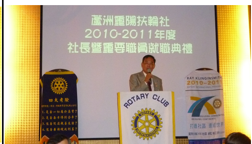
AG Chemi 助理總監致詞