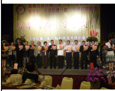
啟動「天使養助行動」慈善拍賣晚會