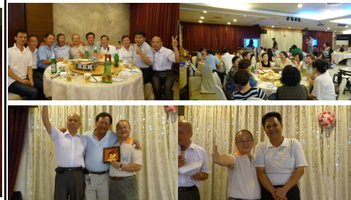
頒發卸任禮品、表揚百分百出率及晚會花絮