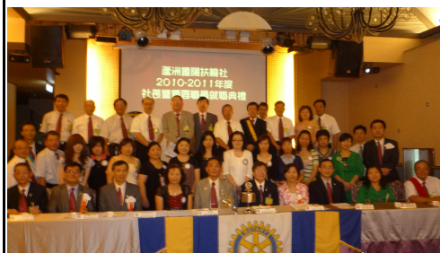
AG Chemi 助理總監伉儷與本分區社長及社友、夫人們合影