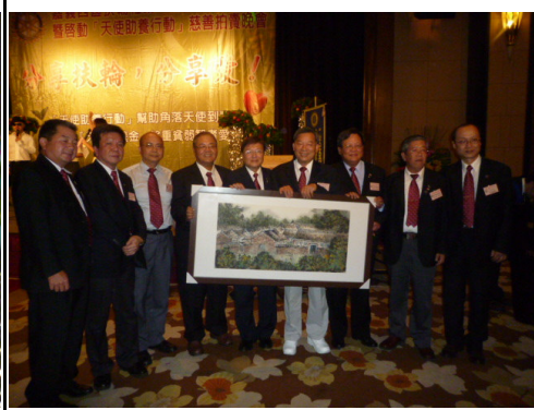
Art 社友愛心不落人後特捐五萬認購一幅畫

扶輪宗旨： 扶輪之宗旨載於鼓勵並培養以服務之理想為可貴事業之基礎，尤其著重於鼓勵並培養：