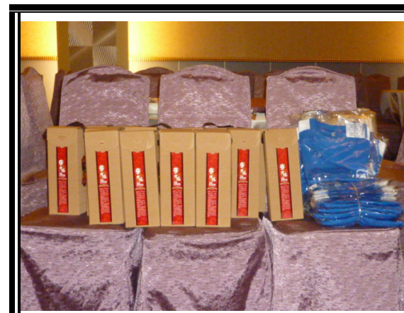
感謝嘉義西區扶輪社贈送每位社友老揚方塊酥乙盒及運動汗衫乙件