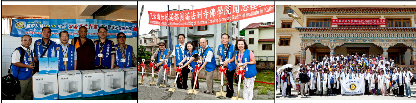
Victor總監、Chemi助理總監代表捐贈尼泊爾淨水設備