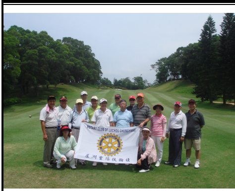
全體球友們 於淡水大屯高爾夫球場合影留念