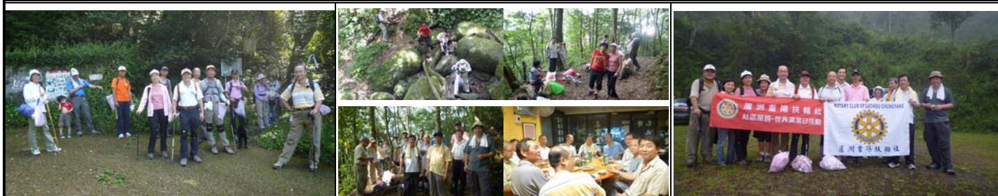
群英相聚於群峰中