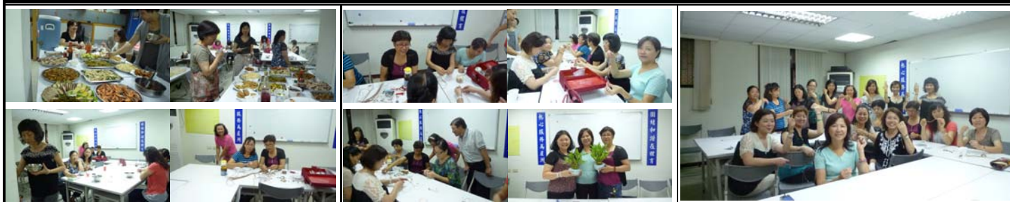
美食當前 慢慢享受