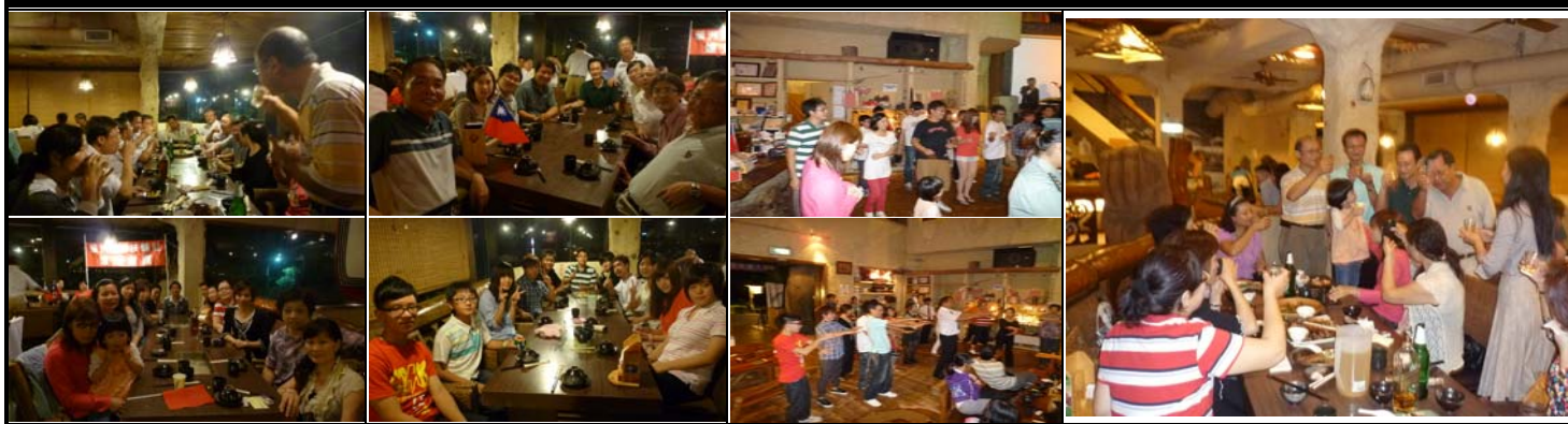
芭達桑原住民餐廳美食同樂剪影