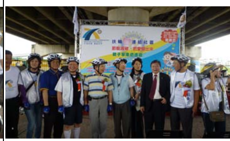
總監與全體參加社長合影