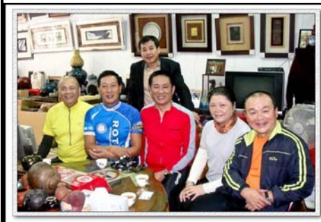
新東、三北、重陽、鶯歌四社聯誼