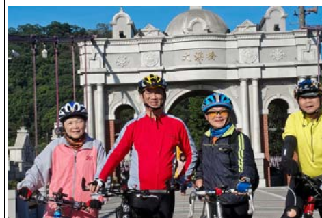
聯合Bike隊騎 大溪古橋留影