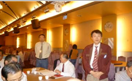
來賓蒞臨本社例會