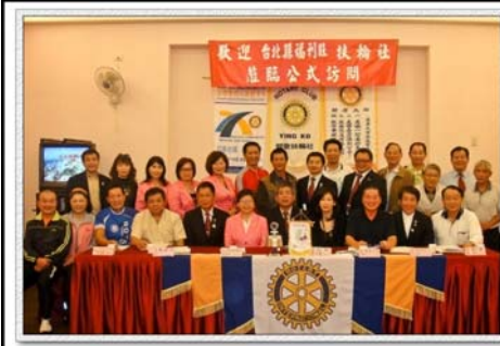
參加友社例會剪影