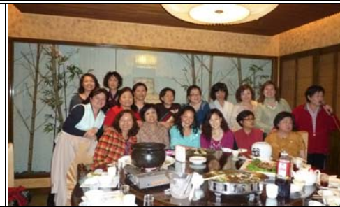
椰林溫泉美食與美女們