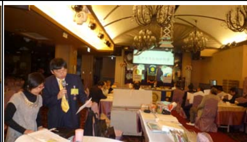
新歌教唱-城裡的月光