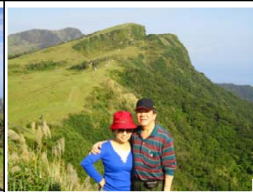
登山副主委 Yellow Peace 伉儷留影