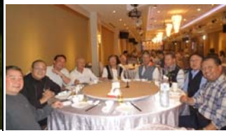
瀟灑揮桿與餐敘言歡