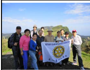
賞芒山脊活動英雄榜