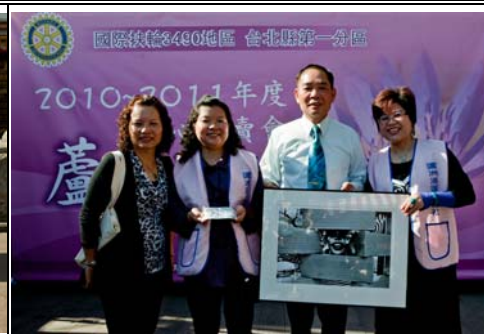
助理總監認購義賣畫作