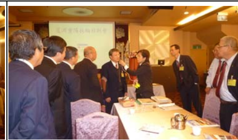
講師解說測試對負離子的反應