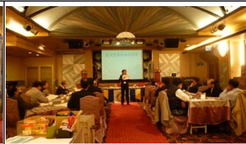
講師演講:全球暖化的嚴重後果