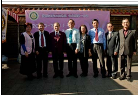
總監與參與活動之社友合影