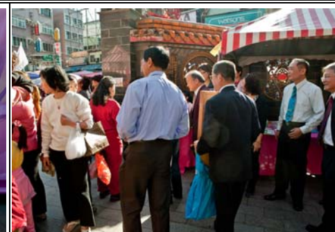
義賣現場熱鬧異常