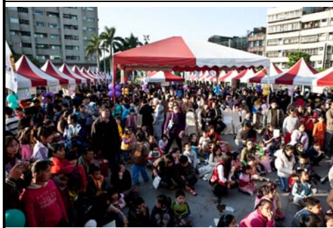
扶輪有愛 暴力不再合影