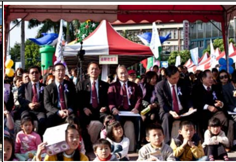
總監與各社社長合影