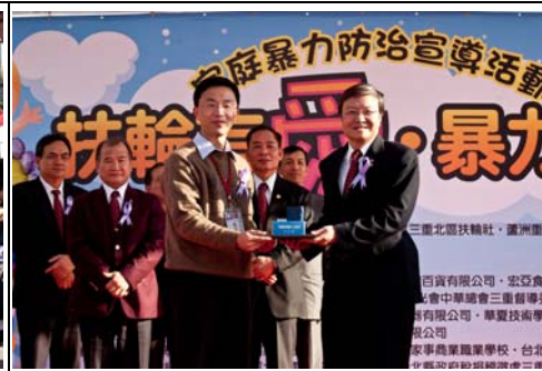
主辦單位頒感謝狀予社長