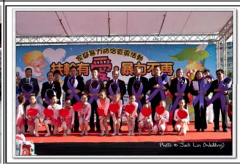
全體社長與總監合影

泰戈爾說：「可能」問「不可能」你住在什麼地方，「不可能」回答說，在那無能為力的夢境裡！