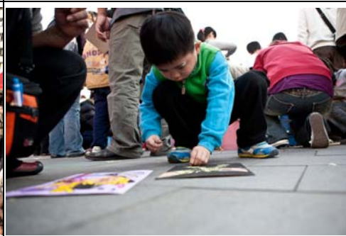
小朋友聚精會神玩遊戲