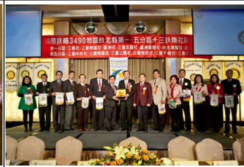
一、五分區社長致贈社旗給講師