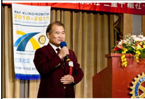
聯合例會總監致詞