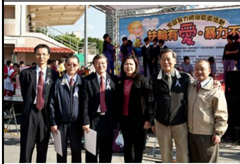
社友參加活動合影