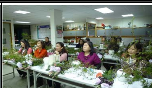
凝神貫注 吸取新資