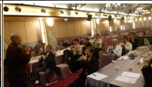
現聽現做 全體動手