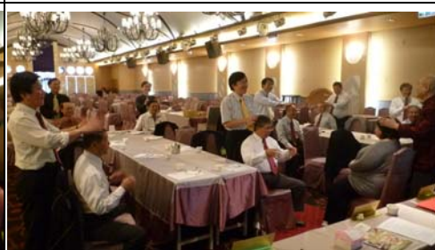
課中實驗穴道，親上陣