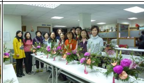
授課完畢、百樣花情