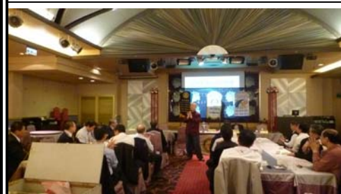
講師妙語如珠 帶動全場