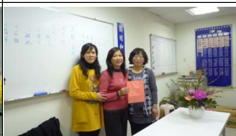
金朱會長感謝講師群